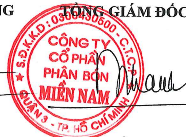
Đặng Tấn Thành