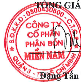
Đặng Tân Thành