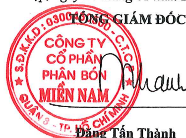
Đặng Tấn Thành